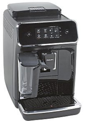
Preissieger: Die Philips EP2231/40 kostet 345 Euro

sind, ist die Möglichkeit wichtig, die Einstellungen zu verändern. Das klappt laut Test gut beim Testsieger De'Longhi, aber auch bei den Geräten von Krups, Siemens, Miele und Saeco. C.M.