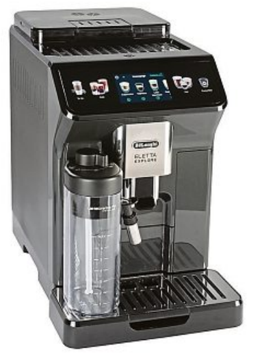
Testsieger: Die De'Longhi Eletta Explore kostet 910 Euro

von Philips, nur weil die Jura sechsmal so viele Kaffeevarianten zubereiten kann. Alle Maschinen brühten auch in Werkseinstellung guten Espresso. Weil Geschmäcker aber natürlich verschieden