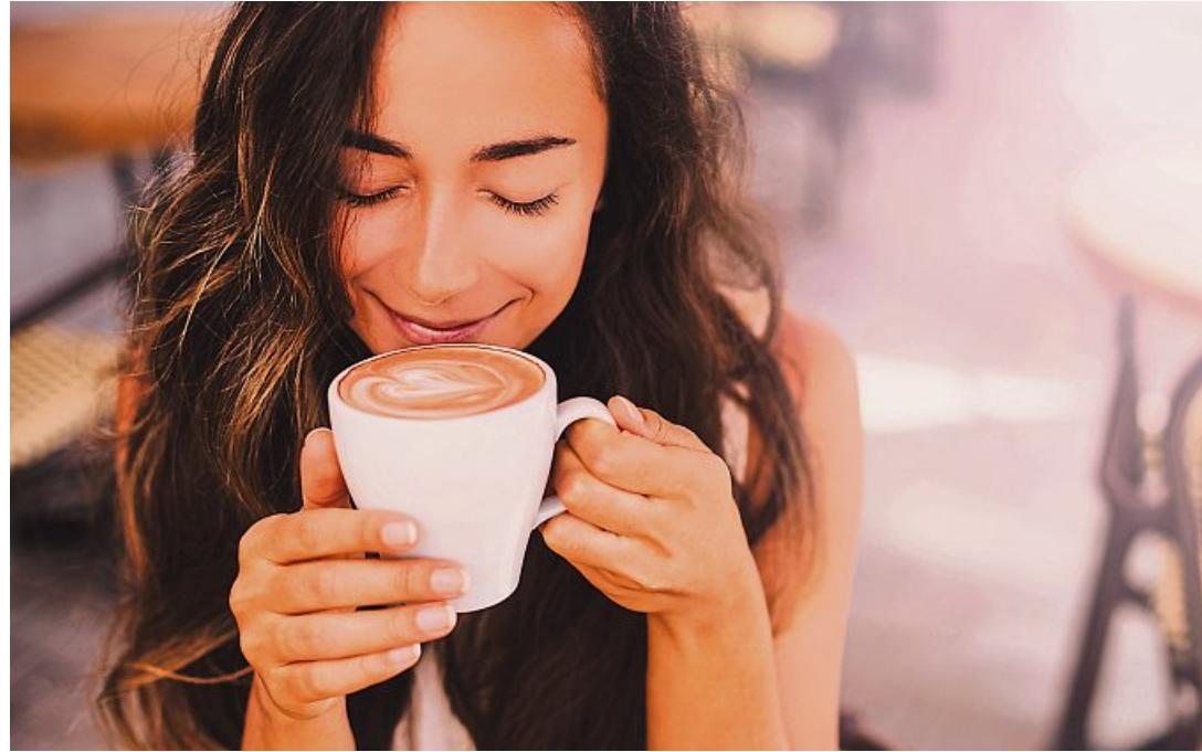
Für Kaffee Genuss sorgen alle elf getesteten Kaffeevollautomaten

Konkret heißt das: Alle Geräte schnitten mit „gut“ ab, das teuerste Gerät im Test für 2130 Euro ebenso wie das günstigste Modell für 345 Euro von Philips (EP2231/40). Das „Preissieger“ Philips nicht auch Testsieger geworden ist, liegt daran, dass man mit dem Automaten nur vier verschiedene Kaffeevariationen zubereiten kann. Der Testsieger von De'Longhi (Eletta Explore, 910 Euro) kommt auf eine Angebotspalette von insgesamt 24 verschiedenen Heiß- und Kaltgetränken. Klassiker wie Latte macchiato hatten bis auf eines der getesteten Geräte aber auch Modelle mit weniger Wahlmöglichkeiten aber Milchschaumfunktion im Sortiment.